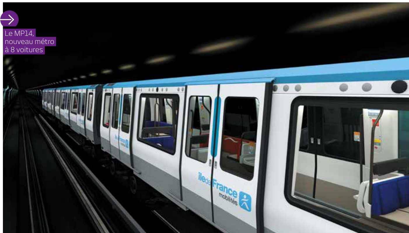
➔ Le MP14, nouveau métro à 8 voitures