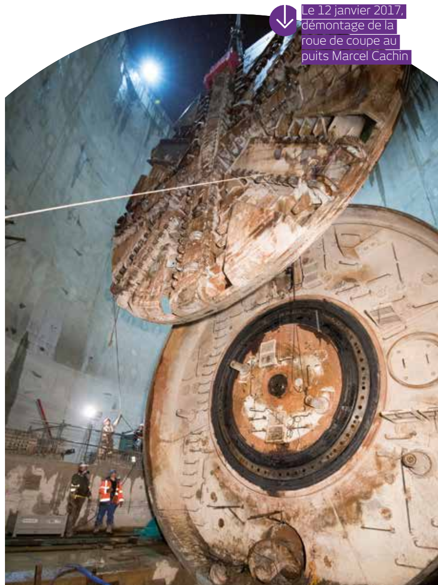
↓ Le 12 janvier 2017, démontage de la roue de coupe au puits Marcel Cachin